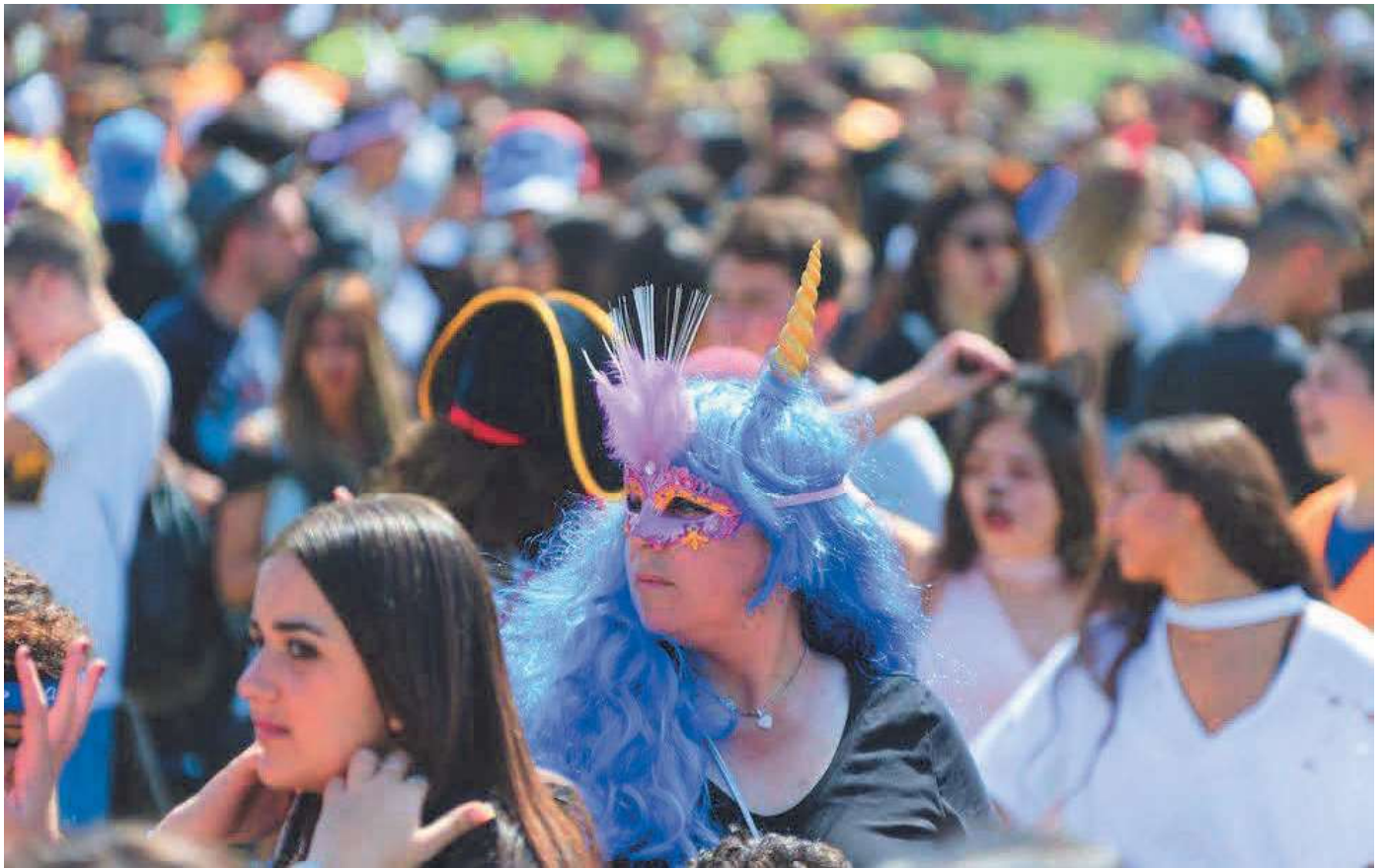
המשתה הפך למסיבה. פורים בתל אביב

מלבד המגילה והמשתה, מתברר שישנם מנהגים נוספים בפורים שהושפעו מהתרבות הפרסית. בראש השנה הפרסי שחל במרץ, סמוך לפורים, נוהגים הפרסים לשלוח מנות מזון איש לחברו - בדומה למשלוחי המנות המוכרים לנו.